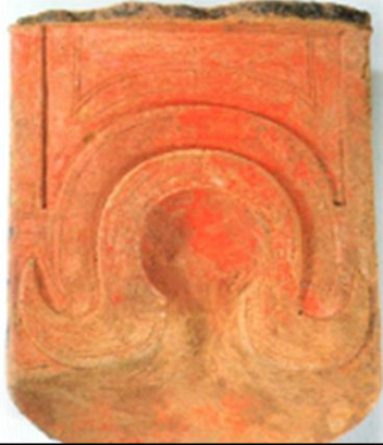
燈籠山古墳出土:埴質枕