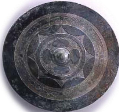
下池山古墳出土:内行家紋鏡