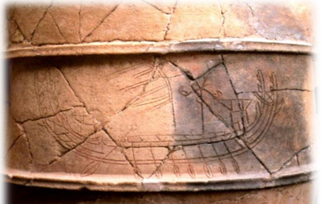
東殿塚古墳出土埴輪に描かれた船画